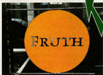
Definitiv die tollsten Süßigkeiten gibt's bei Eduard Fruth. Testen Sie die Trüffel!