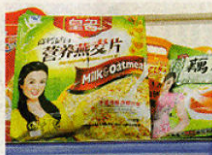
Lebensmittelsensationen bei Hua-Lian, das bemerkenswert besser wurde